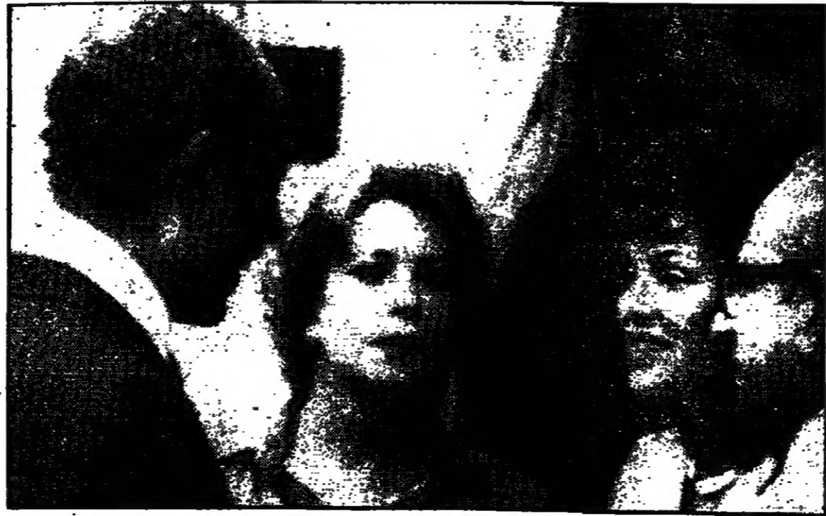
الرئيسان السادات وناسون وعقيلتهما في ميت ابو الكوم .